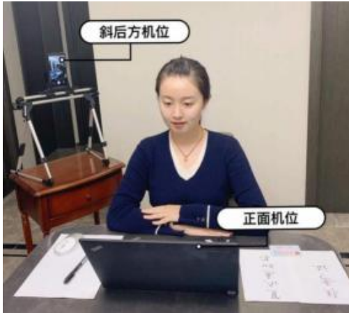
主机位要求如左图